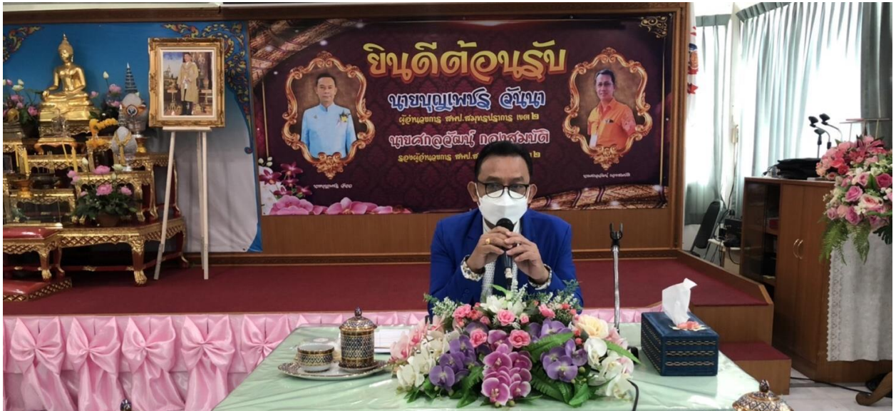
ภาพประกอบการประชุมจัดทำแผนปฏิบัติการประจำปีงบประมาณ พ.ศ. ๒๕๖๕